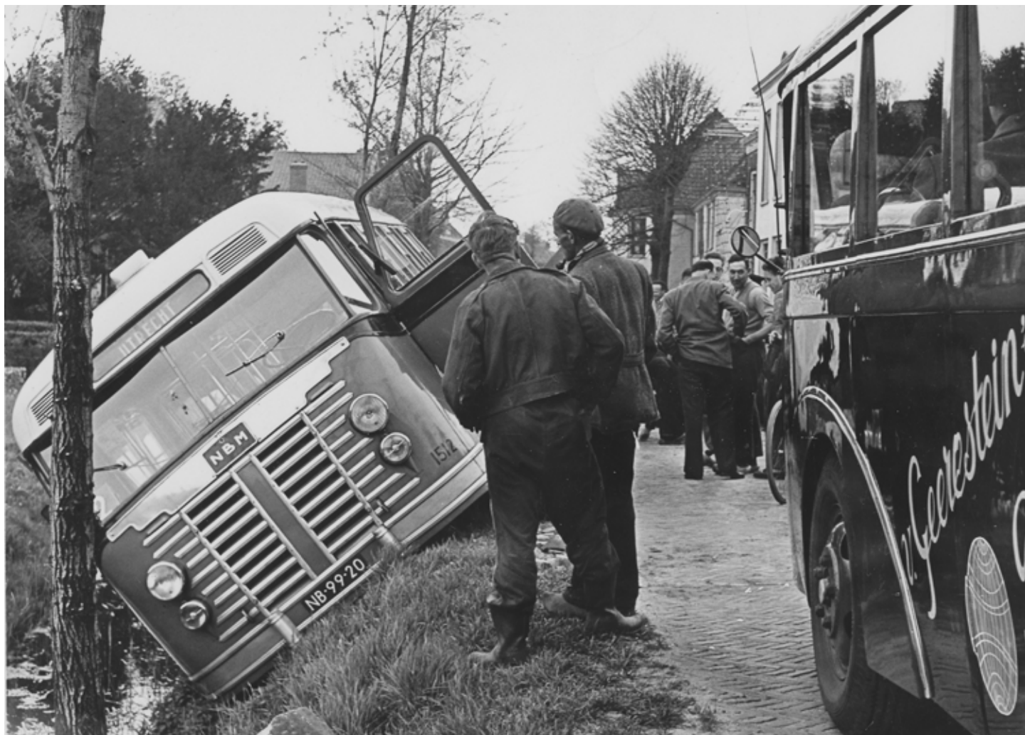
Omgevallen bus bij Loenen

kwamen. Van de twee bussen uit tegenovergestelde richting trok die van de NBM richting Utrecht dit keer aan het kortste eind, zo lijkt het. We dateren deze foto voorlopig tussen 1953 en 1960. Je blijft kijken. En met deze informatie kijk je ook weer anders.