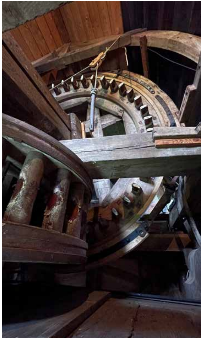
Mechaniek van de Oukoper Molen

Zaterdag 1 juni brachten we een bezoek aan de Oukoper molen. Twee enthousiaste molenaars boden ons een boeiend inkijkje in de eeuwenoude techniek van deze poldermolen. Ook interessant: de sociaal economische positie van de molenaar en zijn gezin en de religieuze gezindheid van de waterschappen. De molen wordt met veel zorg en met gebruikmaking van oorspronkelijke technieken onderhouden (tot en met de reuzel tussen de bewegende houten delen aan toe) en is bij de recente restauratie voorzien van onder meer een nieuw wikenkruis. Al met al een waardige winnaar van de Bronzen Troffel en zeker een bezoek waard. De molen draait meestal op woensdagen en zaterdagen. Dan is er dus ook een molenaar aanwezig om vragen te beantwoorden.